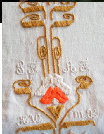
Fire ulike initialer