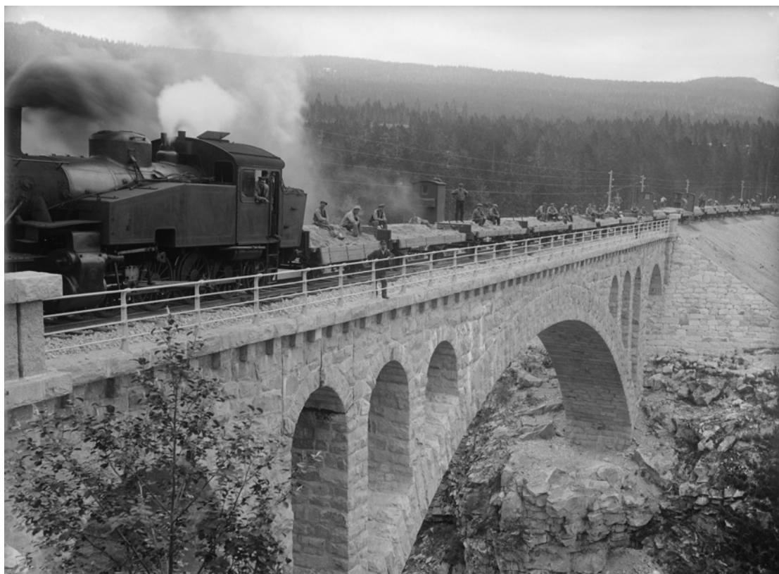
FOTOGRAFI: Jora bru på Raumabanen, antatt 1919. Brua ble bygget i perioden 1912 – 1919.

Digitalt museum legger opp til publikumsmedvirkning. Det er mye kunnskap ute blant folk, og det gis derfor mulighet til å hjelpe museene med mer informasjon om samlingene. Gjennom en kommentarfunksjon kan du komme med innspill. Dette kan for eksempel være å gjen-