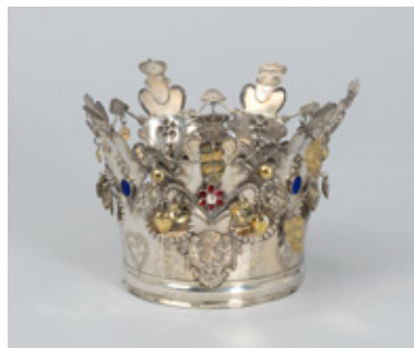
GJENSTAND: Fra museets samling. Brudekrone fra 1885.

kjenne et sted på et fotografi, gi opplysninger om gjenstander som museene ikke vet så mye om, eller korrigere feil. Kommentarene logges hos museene. Museene i Stiftelsen Lillehammer museum mottar mange kommentarer på de publiserte samlingene, og de er til god hjelp.