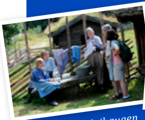
Setra på Maihaugen

Åpent daglig ut august med omvisninger og åpen kafé.