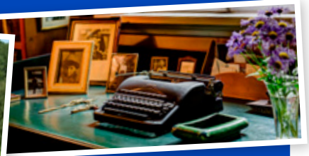
Sigrid Undsets skrivebord på Bjerkebæk.