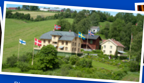
Bjørnstjerne Bjørnsons hjem Aulestad.