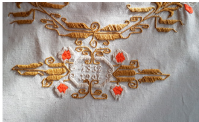
Bjørnsons fødsels- og dødsår

Ved starten av forberedelsene til 100-årsmarkeringen av Bjørnsons død i 2010, så tekstil-